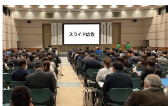
スライド広告イメージ